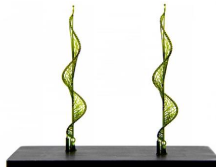
PIC 100 Green