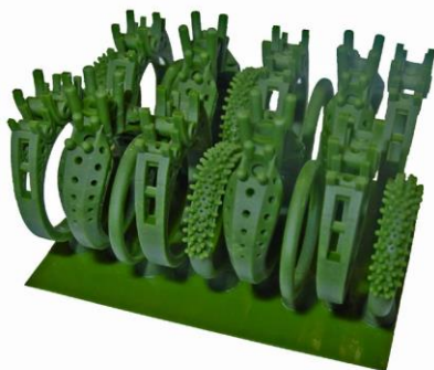
WIC 100 Green